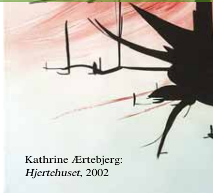
Kathrine Ærtebjerg: Hjertehuset , 2002