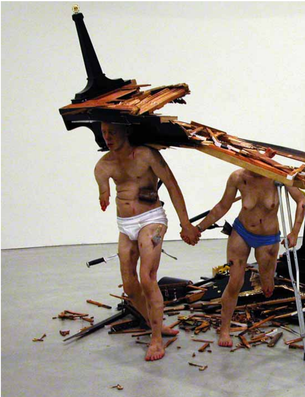
Tony Matelli: Fucked

Gave fra Vilh. Kiers Fond, AarhusKarlshamn, Schouw & Co A/S samt Kulturministeriet (2005)