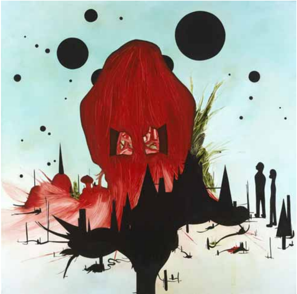
Kathrine Ærtebjerg: Hjerterhuset , 2002 Gave fra Peter J. Lassen, Montana Gruppen (2005) © Kathrine Ærtebjerg/Arken – Museum for Moderne Kunst