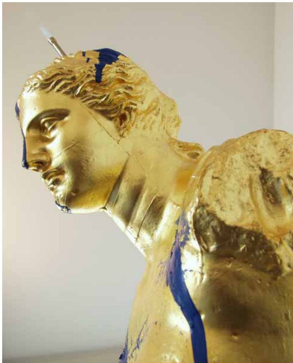
Bjørn Nørgaard: Homage à Yves Klein, 1996 Gave fra Montana Gruppen, Nykredit, Nørgaard på Strøget, en anonym privatperson og Kulturarvstyrelsen (2005)